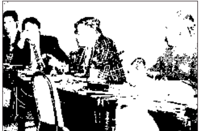
Diskusia počas workshopu / Workshop Discussion