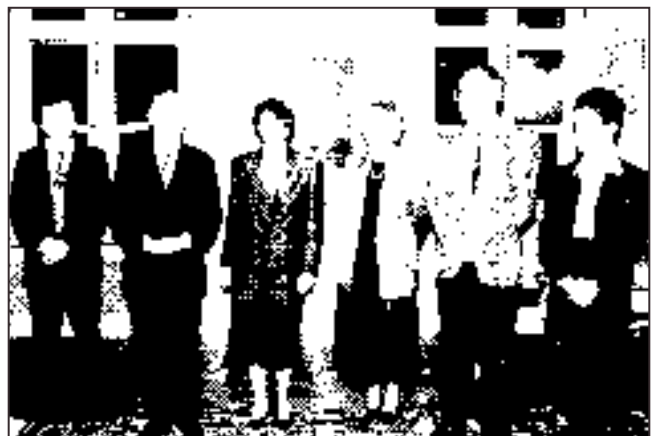
Príhovor primátora Bratislavy / Address of Mayor of Bratislava