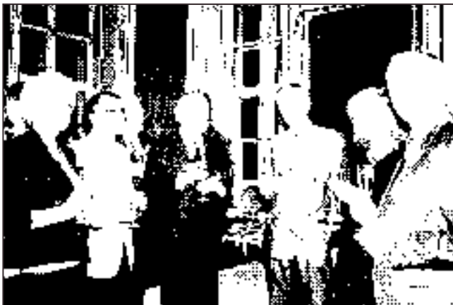
Prípitok u primátora / Toast of the Mayor