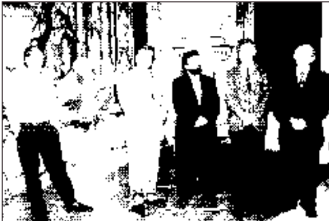
V Primaciálnom paláci / In "Primaciálny" Palace