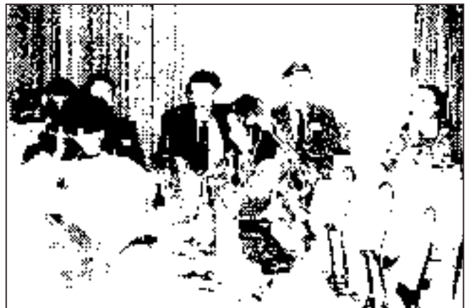
Debata / Debate

Medicína etika & bioetika - Medical Ethics & Bioethics je časopisom Ústavu medicínskej etiky a bioetiky v Bratislave, spoločného pracoviska Lekárskej fakulty Univerzity Komenského a Inštitútu pre ďalšie vzdelávanie zdravotníckych pracovníkov v Bratislave. Je určený pracovníkom etických komisií v Slovenskej republike, ako aj najširšej medicínskej a zdravotníckej verejnosti. Má tiež za cieľ napomáhať medzinárodnú výmenu informácií na poli medicínskej etiky a bioetiky. Prináša správy o činnosti ústavu, informácie o aktuálnych podujatiach a udalostiach v oblasti medicínskej etiky a bioetiky, pôvodné práce, prehľady, reprinty legislatívnych materiálov a smerníc pre oblasť bioetiky, listy redakcii a recenzie. Príspevky a materiály uverejňuje v slovenskom alebo anglickom jazyku. Vybrané materiály vychádzajú dvojazyčne. Vedecké práce publikované v časopise musia zodpovedať obvyklým medzinárodným kritériám (pozri Pokyny prispievateľom - ME&B 2/94).